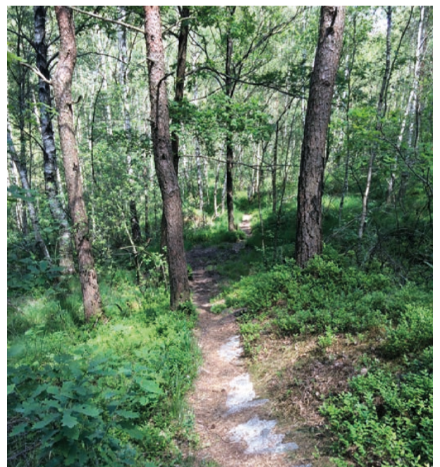
Stien går gjennom blandingskog