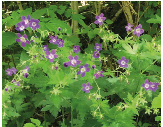
Frodig natur i rundløypa