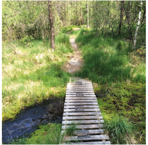
Bro i rundløypa på Gullestad

Turen starter i Liknes sentrum. Gå over gangbrua over elva og ta til høyre ved Kvinabadet. Fortsett noen hundre meter inn Gullestadvegen til du kommer til et postkassestativ. Ta til venstre og følg “rundløype”-skilt tilbake til veien du kom opp.