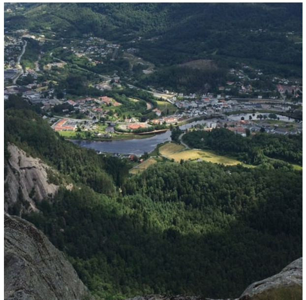
Utsikt mot sentrum fra Nonskarknuden