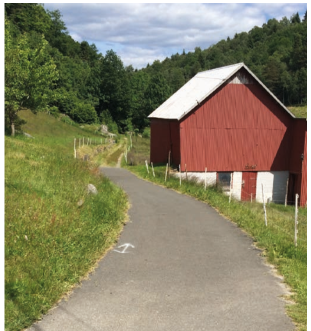
Gammel vei tilbake mot sentrum